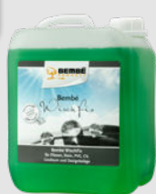
Bembé WischFix 5L